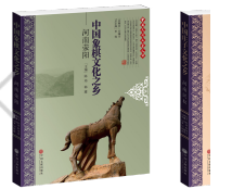
《中国象棋文化》 《中国象棋文化——河南》