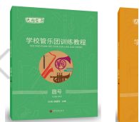
《学校管乐团训练教程 圆号》