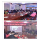
甘州区文化馆召 (图)