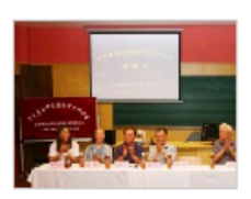
宋代音乐研究国际...