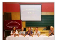
宋代音乐研究国际…