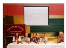
宋代音乐研究国际…