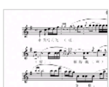
长调到短调的衍变…