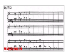
利盖蒂第一册六首…