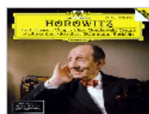
唱片封面上的视觉…