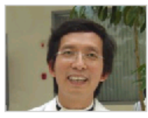
把音乐还给音乐教…