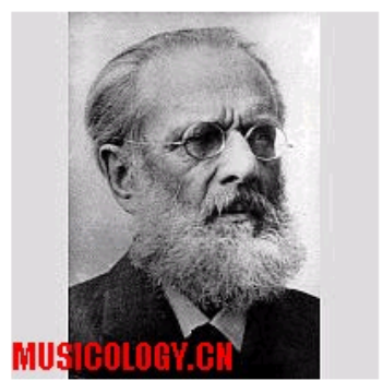
德国音乐心理学家斯图姆夫

摘要： 本文以斯图姆夫的生平为主线，展现了他幼年的音乐天赋，青年时代的求学，到后来在哲学、心理学和音乐心理学研究中的奋斗过程。在近50年工作期间，他先后任职于符茨堡大学、捷克布拉格大学、哈勒大学、慕尼黑大学及柏林大学等，还创立了著名的柏林心理学实验室。通过他的研究道路可以较全面地了解斯图姆夫。