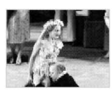
蒙特威尔第与格鲁...