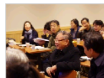
中国传统音乐教学