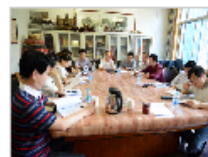
中国传统音乐学会