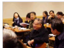
中国传统音乐教学