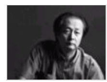
赵季平当选中国音