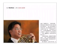
韩小明出任国家大