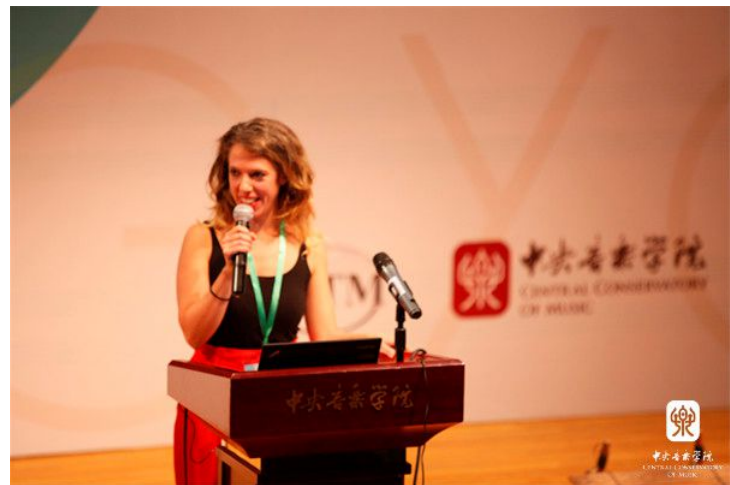
在为期三天的会议里,六十余名学者陈述了有关音乐医学与治疗、以音乐教育实践和方法促进社会文化融合的全球视角、音乐结构/曲式/曲目于原生音乐教育的表演和实践的应用中、英国视角下促进社会文化融合的音乐教育实践与方法、音乐与机构、音乐与性、音乐和文化遗产、音乐与宣传、音乐与政策等为主题的17场论文报告,以及以“音乐与机构”“嵌入式社会话语的隐形化:在正规教育和社会文化认知之外的相关内容与实践之间的关系”“民族音乐学的推动:研究、应用和参与”“音乐与宣传”为题的12个单元的陈述与研讨在琴房楼演奏厅和阶梯教室同时进行。这次会议还首次采用了Skype演示,让那些因为经济、身体或时间离场的发言者通过远程的方式向参会者陈述自己的论文。