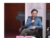
中国音乐发展高峰