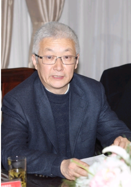
北京大学党委副书记杨河致辞

北京市委宣传部常务副部长王海平致辞，他高度肯定了音乐剧的发展在文化大发展大繁荣中的重要意义，并对音乐剧在中国的创作研究现状做了详细的阐述。他以音乐剧的“东方面貌”“东方风格”勉励和祝愿北大艺术学院民族音乐与音乐剧研究中心健康发展，为国家音乐剧事业贡献自己的力量。