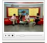
刘震云谈中法文学