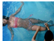
艺术家手绘游泳者