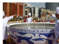
最大碗的黑芝麻糊