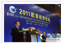
李长春出席欧亚经济论坛