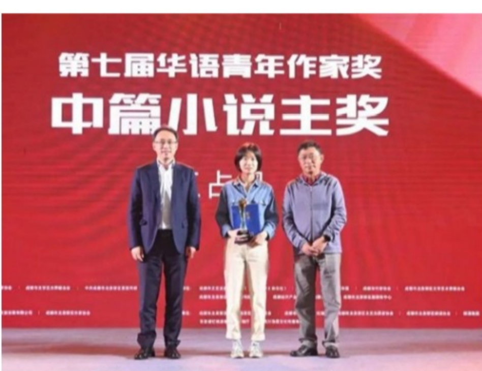
阿来（右1）给获奖作家颁奖（往届华语青年作家奖颁奖典礼现场）

第八届华语青年作家奖要来啦！2023年1月16日，由成都市文联指导，成都市文艺发展服务中心（《青年作家》杂志社）、封面新闻、华西都市报主办的“第八届华语青年作家奖”盛大启幕，面向全球征稿。