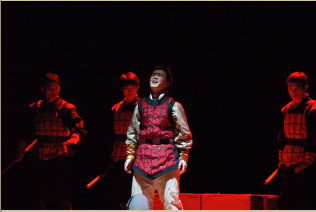
浙江大学黑白剧社2 ..