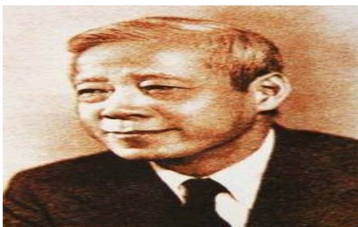
陈毓贤：洪业怎样写杜甫