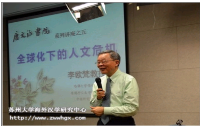
李欧梵教授演讲《全球化下的人文危机》...