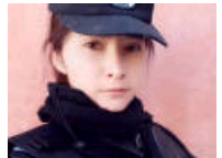
新疆美女民警走红