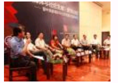
高校及传媒界专家齐聚交大共议“新媒体与社会发