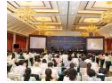
第四届证据理论与科学国际研讨会在京召开