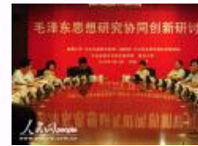
“毛泽东思想研究协同创新”研讨会在京举行