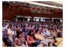
清华举办中国与世界经济论坛 解析当前中国经济