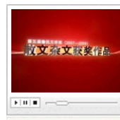
第五届鲁奖-散文 颁奖仪式