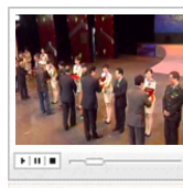
第五届鲁奖-诗歌 颁奖仪式