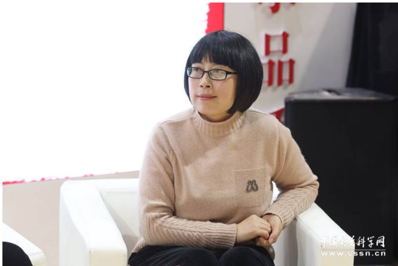
北京八一学校高级教师徐德琳高度评价该书。