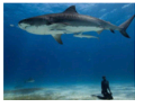
充满奇迹的地球上