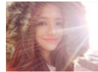
武大校花清丽脱俗