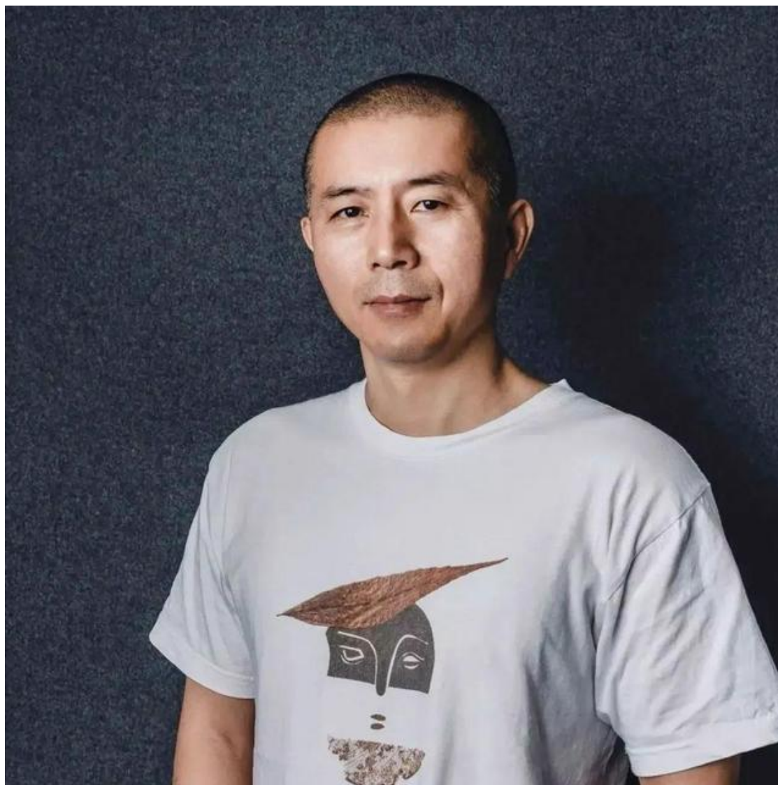
南京大学文学院教授，江苏省作家协会主席，茅盾文学奖、鲁迅文学奖获得者，当代著名作家毕飞宇领衔开讲！