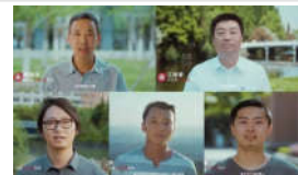
成为更好的大学,遇见更好的你