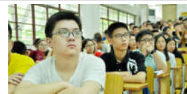
这是新生的第一堂思政课!