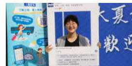
2018ECNUers今日相遇 未来可期