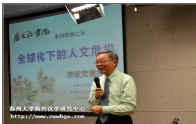
李欧梵教授演讲《全球化下的人文危机》...