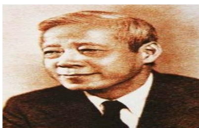
陈毓贤：洪业怎样写杜甫