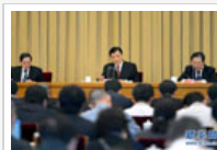
项目评审工作会议