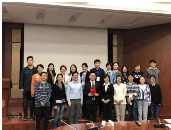
参赛教师与助赛师生合影留念