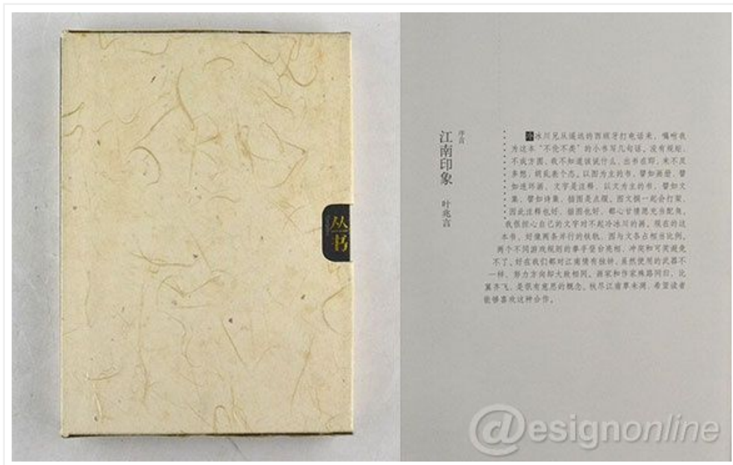
— 图3: 对影丛书——江南印象

基于宋体字的审美性，被广泛使用在标题或正文排版印刷设计中。根据字体使用地方的不同，在字体大小、间距、版式处理上也有所不同，其产生的视觉效果也不同。如图3此书在封面上仅用简洁秀丽的宋体字形式来突出主题，背景大面积留白。正文部分同样使用宋体字来排版布局，只是在字号和版式上有别于封面的设计，整体上给人一种清秀雅致之感。