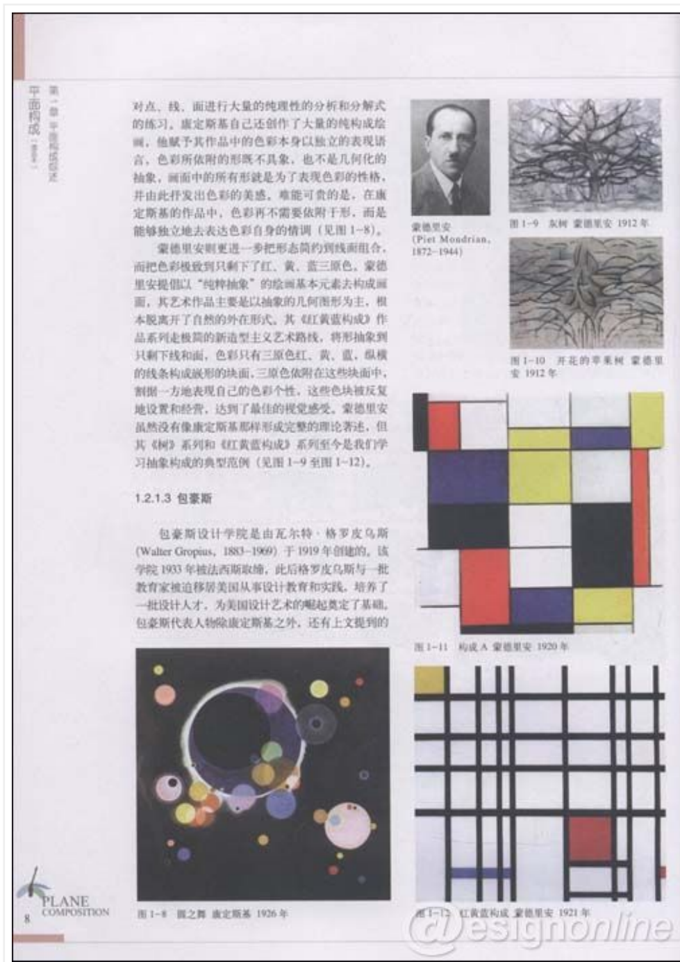
一 图1：《平面构成（图说木）》内页

用，不管是视觉上还是心理上更易于人们所接受。如：网页、各软件的界面、书籍等，凡是需大面积使用字体的地方都能看到宋体字的身影。可见，宋体字如此广泛的应用，与宋体字的易读性是分不开的。