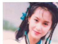
朱茵清纯惊艳旧照