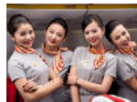
盘点各国空姐风采