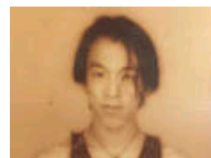
黄渤长发青春旧照