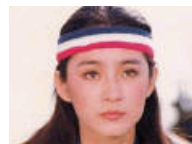
惊艳了时光的明星