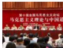
第十届全国马克思主义论坛在西安召开