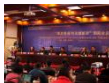
第九届旅游前沿国际学术研讨会“旅游景观与边地”