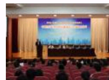
第四届《金融研究》论坛暨金融创新高端论坛在南