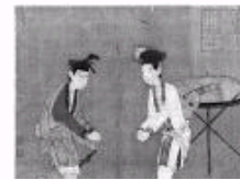
十年磨砺宝剑锋——评《辽宋西夏金代通史》