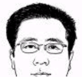
科学认识当代资本主义的有力武器