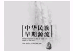
民族源头的探险与朝圣