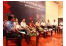
高校及传媒界专家齐聚大共议“新媒体与社会发