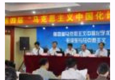
第四届“马克思主义中国化论坛”在吉林大学举办