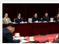
两会新闻宣传总结会议