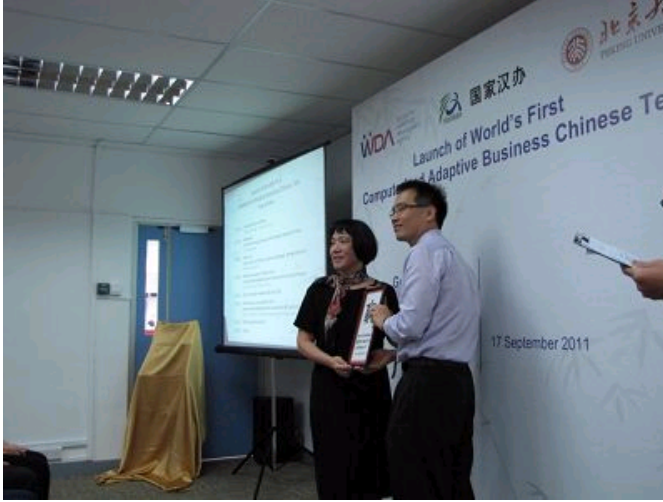
新加坡劳动力发展局局长黄宏冠先生向张英院长赠送纪念牌

商务汉语考试自适应测试系统新闻发布会后，北大研发团队负责人兼首席专家鹿士义博士向来宾和媒体介绍了商务汉语考试自适应测试系统的功能及技术创新。来宾及与会人员兴致勃勃地体验了自适应测试系统。