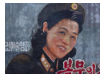
朝鲜电影业的现状