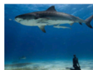
充满奇迹的地球上