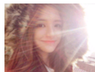
武大校花清丽脱俗