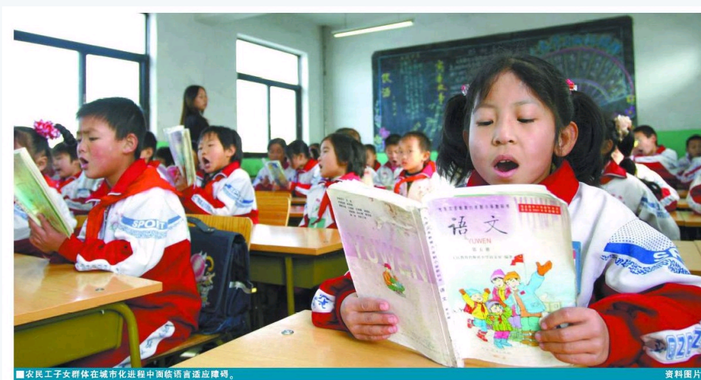
农民工子女群体在城镇化进程中面临语言适应障碍。

【核心提示】 构建农民工子女语言适应体系,推进语言系统与社会系统之间的适应性研究,是化解其语言适应障碍的有效途径,也是验证语言研究向社会应用转化之可行性的有效途径。