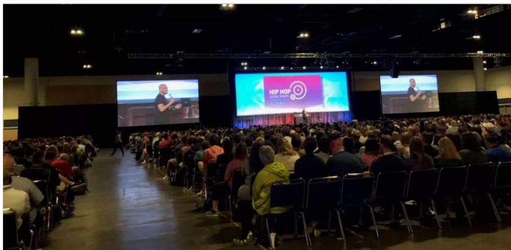
2019 SHAPE America主会场

SHAPE America (Society of Health and Physical Educators) 是全美最大的健康与体育专业组织。其前身为美国健康、体育与休闲联盟 (AAHPED)，该组织成立于1885年，是美国最大的健康与体育专业组织。SHAPE America与美国50个州进行合作，负责定义卓越体育的概念，提供、宣传和支持各个层面（从幼儿园到研究生）体育教育者的专业课程。美国体育与健康教育协会 (SHAPE America) 年会是美国体育教育领域最具影响力的会议。在论坛期间，将公布最新版体育与健康、艺术教育课程国家标准，也会展示体育教育、健康促进领域的最新的设备及科技产品，全美及国际参会人员超过5000人。会议举办期间还有几十场专题报告、工作会议及讨论活动。国际华人体育与健康学会举办的第五届论文报告会是此次“美国体育与健康教育协会2019年年会”的重要组成部分之一。