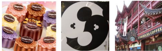
图1 文化混搭的一些例子

随着全球化的推进,我们在生活中有越来越多的机会同时接触到多种文化。当两种及以上的文化元素同时出现称为文化混搭(Cultural Mixing)。文化混搭是近年来非常常见的现象,在生活中比比皆是,例如星巴克的月饼和粽子,古街上的麦当劳和星巴克等等。不同类型的混搭元素会给人带来不一样的心理体验。中国科学院行为科学重点实验室蔡华俭研究组揭示了入侵性的文化混搭对文化群体间内隐偏见的影响。