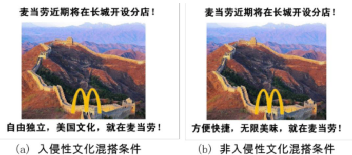
图2 文化混搭实验材料

该研究使用了一组麦当劳将在长城开设分店的广告作为文化混搭的材料。广告中有一张麦当劳的logo压在长城的图片,以及一则广告语。入侵性文化混搭条件下的广告语为“自由独立,美国文化,就在麦当劳!”;而非入侵性文化混搭条件下的广告语为“方便快捷,无限美味,就在麦当劳!”另外设置了一个控制组,不观看任何广告。观看完材料后,参与者需要完成简式内隐联系测验(BIAT, Sriram & Greenwald, 2009),测量他们对于美国的内隐态度。