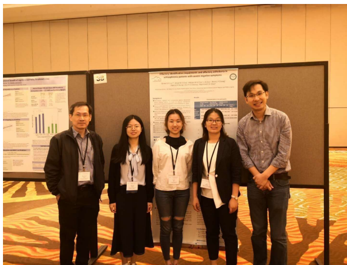
NACN实验室成员在SIRS会议上的合影