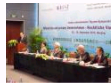
第四届蒂森国际论坛在南京大学举办