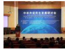
中共促民生发展研讨会在北京外国语大学召开