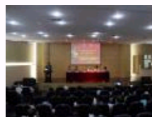
首届民国时期经济思想研讨会在校召开