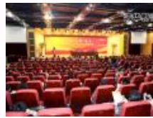
2013年经济发展高峰论坛在清华举行