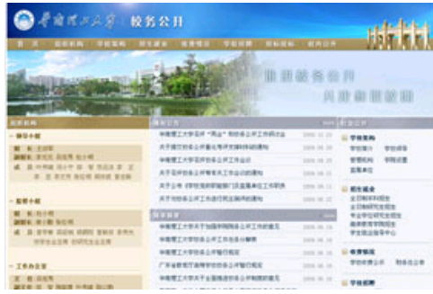
校务公开专题网站