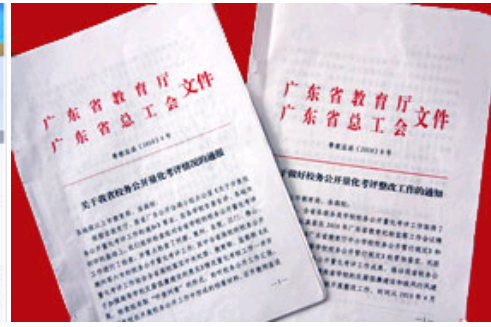
省教育厅、省总工会发来通报

近日，从省教育厅、省总工会发来的《关于我省校务公开量化考评情况的通报》（粤教监函（2010）6号）和《关于做好校务公开量化考评整改工作的通知》（粤教监函（2010）8号）中获悉，华南理工大学顺利通过省教育厅、省总工会组织的校务公开量化考评，得到了良好的评价。