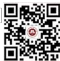
福建师范大学 官方微博